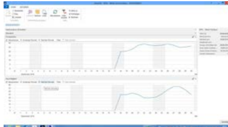
Grafische Darstellung der übertragenen Sensordaten

Sie werden schnell und umfassend mit relevanten Trackingdaten versorgt: Die Statusmeldungen stehen ab dem Tag der Verladung zur Verfügung und werden täglich aktualisiert, so dass Sie immer auf dem Laufenden sind. Neben dem aktuellen Status werden auch Informationen über den gesamten Verlauf Ihrer Sendung zur Verfügung gestellt.